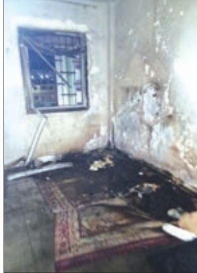
الطبية. وأشارت مصادر متطابقة أن العائلة استفادت من هذه الشقة السكنية قبل أشهر فقط في إطار برنامج الترقوي المدعم، بعد

يروى أحد سكان بلدية عين فكان أنه 'كانت الساعة تشير إلى الساعة وخمس وأربعين دقيقة عندما انتشر خبر اندلاع حريق على مستوى شقة سكنية تقع بحي 100 سكن ترقوي مدعم، حيث هرع الجميع باتجاه الحادث في محاولة لمعرفة ما حصل ولتقديم المساعدة إن استدعى الأمر ذلك، وما هي الإلحاحات حتى كان الموقع يعج بحركة كبيرة، وتواجد كبير لمصالح الأمن وعناصر الحماية المدنية"، وأضاف محدثنا بالقول "بما أن المؤكد هو اندلاع حريق على مستوى شقة تقع في الطابق الخامس للعمارة فإن أسبابه بقيت مجهولة، إذ اتجهت غالبية الأقوال نحو فرضية شرارة كهربائية نجمت عن شاحن للهاتف النقال، زادت تهييزات المسكن وأثاثه اشتعالا في وجود طفلين، وآخر عمره 10 سنوات، ما أدى إلى وفاة طفل يبلغ من العمر أربع سنوات، بينما تم إنقاذ شقيقه وطفل آخر تتراوح أعمارهما ما بين 8 و10 سنوات أصيبا باختناق، حيث يتواجد أحدهما وامرأة في المستشفى تحت المراقبة