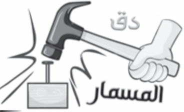
بقلم: طاهر حليسي